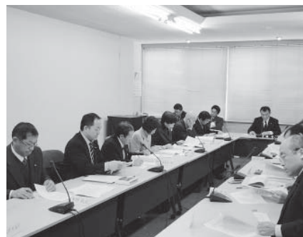
③議員協議会で協議