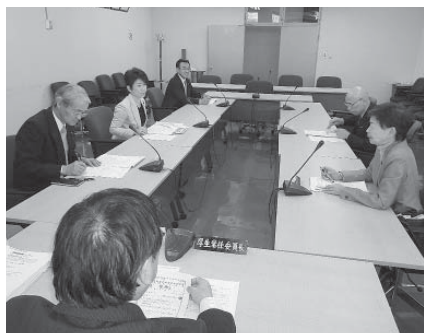
②各常任委員会で調査・協議