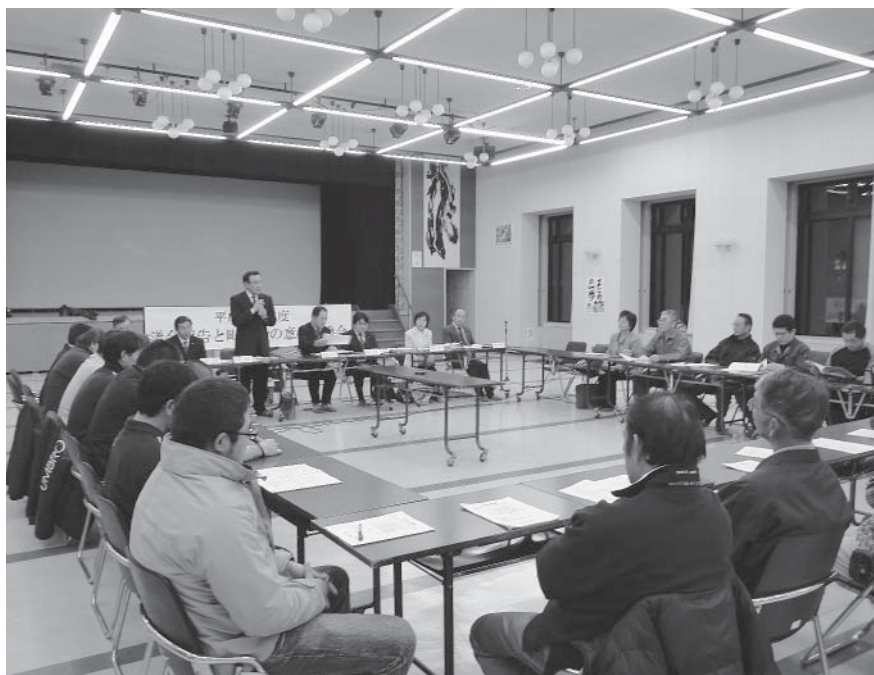
6会場で98人が参加し活発な意見交換が行われた

芽室町議会では、今回で3回目の開催となる「議会報告と町民との意見交換会」（以下、「意見交換会」）を、平成23年10月18日から11月21日にかけて町内6会場で開催し、98人の町民の皆さんにご参加をいただきました。この意見交換会は、町民の皆さんの提案や意見を聞く場をつくり、議会内の議論や政策形成につなげていくことを目的に開催したものです。その概要をお知らせします。