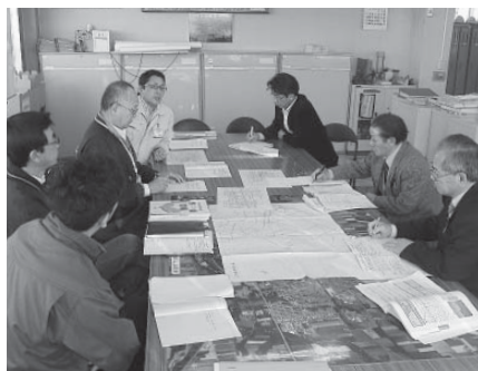
①各課へ出向き調査

町民の皆さんから出された意見等を基に、新たな課題や問題について各委員会で事務調査を行い、町の総合計画や予算化等に結びつけるなど政策化を検討しています。